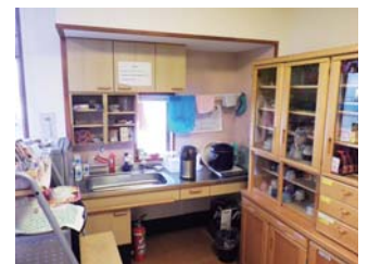
台所も自由に使えます

24 時間体制の医療に見守られながら、安心して専門の介護を受けることができます。