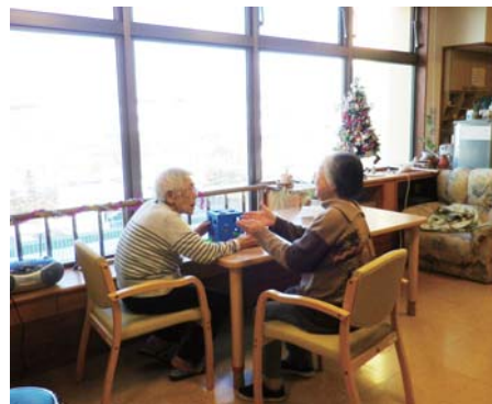
空港を望むリビング